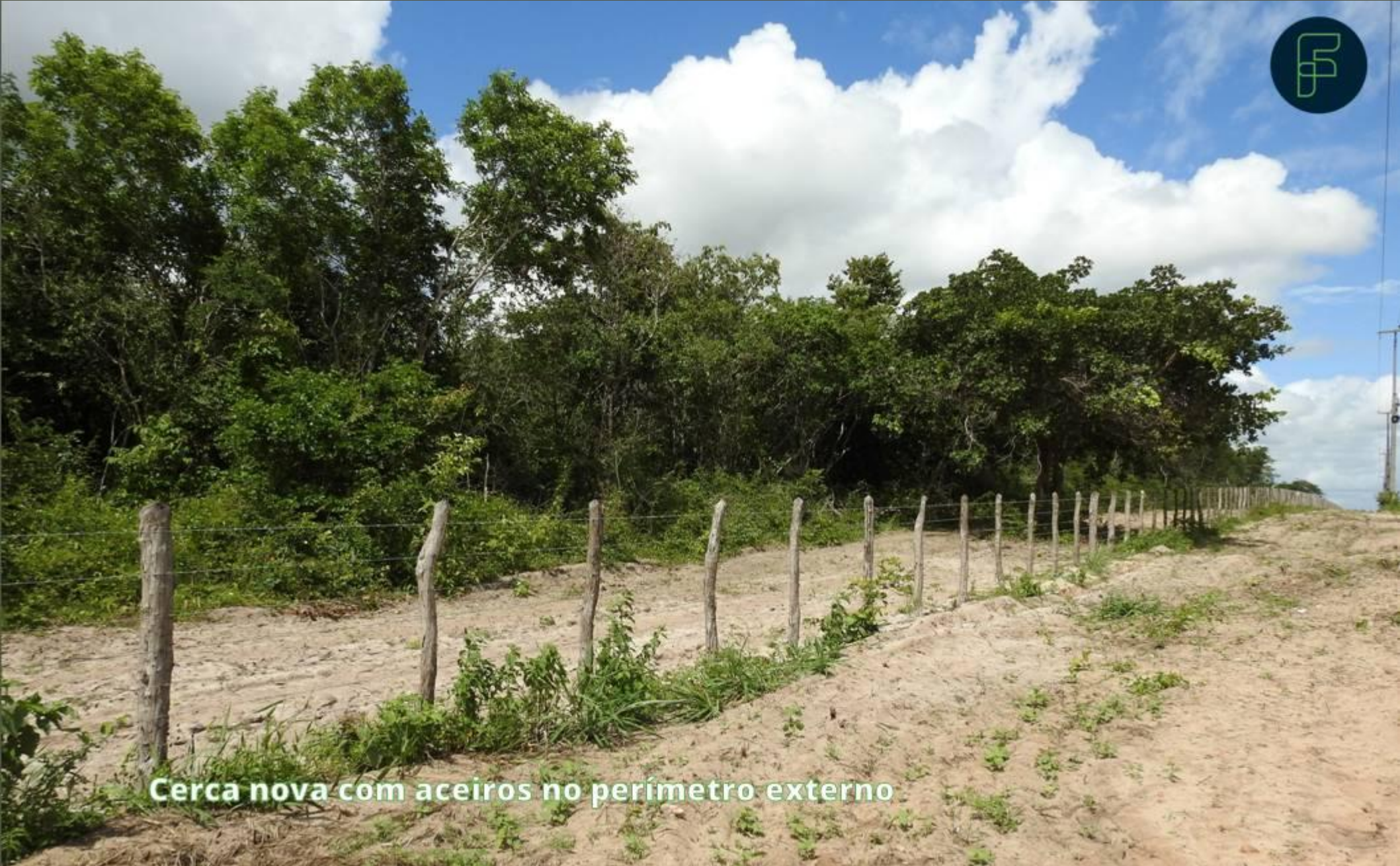
Cerca nova com aceiros no perímetro externo